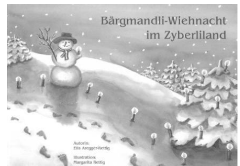
Bärgmandli-Wiehnacht ISBN-Nr. 978-3-907821-58-9